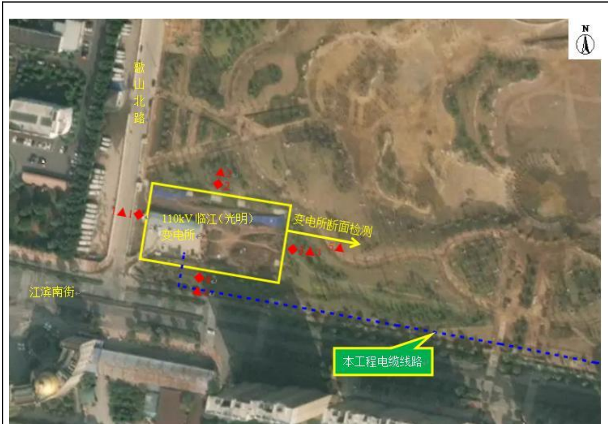
图 8-1 110kV 临江（光明）变电站类比监测点位示意图