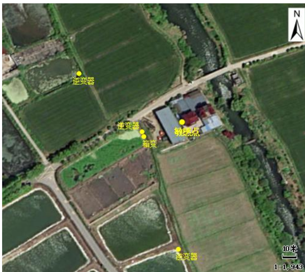
图 4-3 噪声源布置情况

本项目逆变器、箱变等设备与道路、河岸等边界最近距离为 10m，最近敏感点距离光伏区边界约 35m，噪声源逆变器、箱变拟定布置情况见图 4-3。